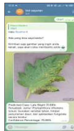
Gambar 2. Proses Input Gambar Daun

Setelah sistem aktif, pengguna dapat melanjutkan proses identifikasi dengan mengirimkan gambar daun tomat yang ingin diperiksa. Gambar yang dikirimkan akan diterima oleh sistem sebagai data masukan untuk dilakukan analisis. Sebelum proses klasifikasi dimulai, citra terlebih dahulu melalui tahap preprocessing seperti penyesuaian ukuran gambar dan normalisasi data agar sesuai dengan format input model MobileNet. Selanjutnya proses input gambar daun ditampilkan pada Gambar 2 [17].