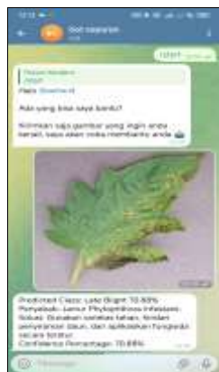
Gambar 1. Tampilan Awal Bot Telegram

Hasil penelitian ini berupa sistem klasifikasi penyakit daun tomat berbasis Bot Telegram yang dirancang untuk membantu pengguna dalam mengenali kondisi daun tanaman secara otomatis melalui citra digital. Sistem memanfaatkan model MobileNet sebagai metode klasifikasi gambar dan Telegram Bot sebagai media interaksi antara pengguna dengan sistem. Dengan sistem ini, pengguna cukup mengirimkan gambar daun tomat melalui aplikasi Telegram, kemudian sistem akan memproses gambar dan menampilkan hasil identifikasi penyakit secara otomatis. Pendekatan ini memberikan kemudahan karena dapat digunakan kapan saja dan di mana saja melalui perangkat smartphone [15]. Pada tahap implementasi, sistem terlebih dahulu diuji untuk memastikan proses interaksi antara pengguna dan bot berjalan dengan baik. Pengguna memulai penggunaan sistem dengan mengakses akun bot pada aplikasi Telegram dan memberikan perintah awal agar sistem aktif. Setelah itu, bot akan menampilkan pesan sambutan serta petunjuk singkat penggunaan sistem. Selanjutnya tampilan awal sistem ditampilkan pada Gambar 1 [16].