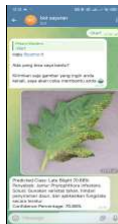
Gambar 3. Hasil Prediksi Penyakit

Setelah gambar berhasil diterima dan diproses oleh sistem, model MobileNet akan melakukan klasifikasi berdasarkan pola visual yang terdapat pada citra daun. Sistem kemudian mengirimkan hasil prediksi kepada pengguna melalui Telegram. Informasi yang ditampilkan meliputi nama penyakit, tingkat kepercayaan prediksi, penyebab penyakit, serta saran penanganan awal. Pada contoh pengujian, sistem mendeteksi penyakit Late Blight dengan confidence sebesar 70,88%. Selanjutnya, hasil prediksi sistem ditampilkan pada Gambar 3 [18].