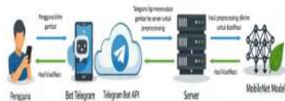
Gambar 2. Arsitektur Sistem

terlibat dalam sistem. Sistem dirancang menggunakan arsitektur client-server, di mana pengguna berinteraksi melalui Bot Telegram sebagai antarmuka, sedangkan proses pengolahan data dilakukan pada server. Arsitektur sistem yang digunakan dapat dilihat pada Gambar 2.